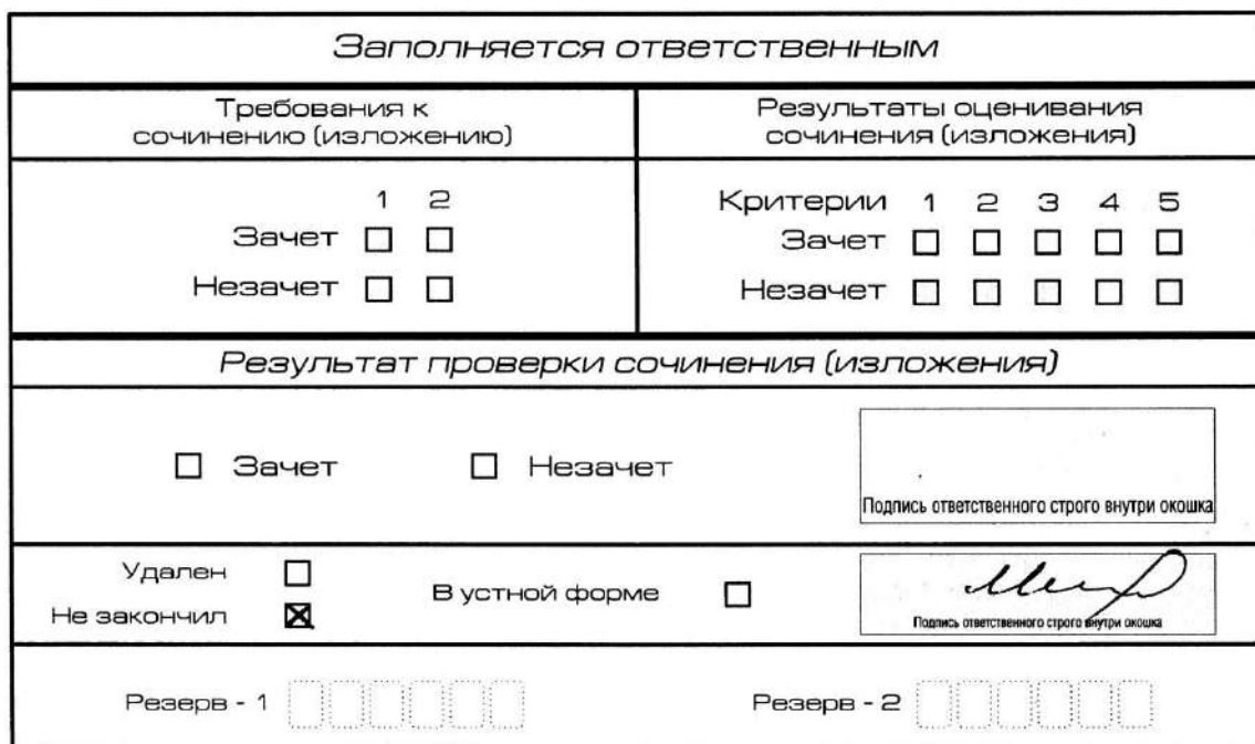
Рис. 12. Заполнение полей нижней части бланка регистрации (участник не закончил написание сочинения (изложения) по уважительным причинам)

В случае если участник итогового сочинения (изложения) по состоянию здоровья или другим объективным причинам не может завершить написание итогового сочинения (изложения), он может покинуть место проведения итогового сочинения (изложения). Члены комиссии по проведению итогового сочинения (изложения) составляют «Акт о досрочном завершении написания итогового сочинения (изложения) по уважительным причинам» (форма ИС-08), вносят соответствующую отметку в форму ИС-05 «Ведомость проведения итогового сочинения (изложения) в учебном кабинете ОО (месте проведения)» (участник итогового сочинения (изложения) должен поставить свою подпись в указанной форме). В бланке регистрации указанного участника итогового сочинения (изложения) необходимо внести отметку «Х» в поле «Не закончил» для учета при организации проверки, а также для последующего допуска указанных участников к повторной сдаче итогового сочинения (изложения) в дополнительные сроки. Внесение отметки в поле «Не закончил» подтверждается подписью члена комиссии по проведению итогового сочинения (изложения) (см. рис. 12).